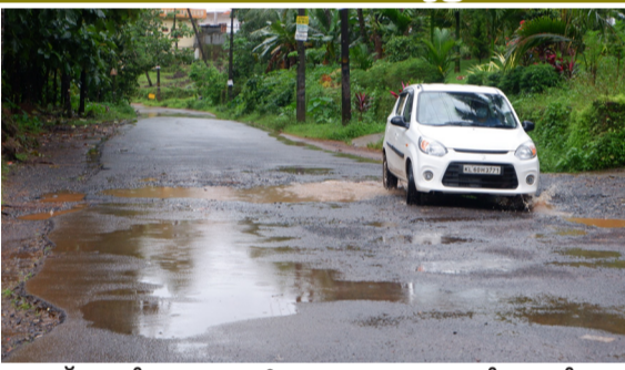
റോഡ് എവിടെ മക്കളേ? കൂളുമായ അങ്ങാടിക്കടവിലെ റോഡ്