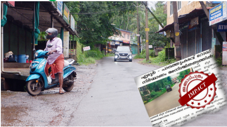
അങ്ങാടിക്കടവ് - വാണിയപ്പാറ റോഡ്