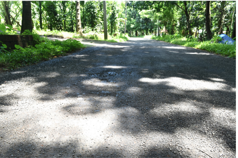
ഒരു മാസത്തിനുള്ളിൽ തകർന്ന മുടയിരിഞ്ഞി - കാപ്പിൽ - പുനക്കുണ്ട് - വാണിയപ്പാറ തട്ട് റോഡ്

മുടയിരിഞ്ഞി: അയ്യൻകുന്ന് ഗ്രാമ പഞ്ചായത്തിലെ മുടയിരിഞ്ഞി - കാപ്പിൽ - പുനക്കുണ്ട് - വാണിയപ്പാറ തട്ട് റോഡ് നിർമ്മാണം പൂർത്തിയായി ഒരു മാസത്തിനുള്ളിൽ തകർന്നു. കഴിഞ്ഞ മാസമാണ് ജില്ലാ പഞ്ചായത്ത് ഫണ്ടിൽ നിന്നും 30 ലക്ഷം രൂപ വകയിരുത്തി രണ്ടര കിലോമീറ്ററോളം റോഡ് പണി പൂർത്തിയാക്കിയത്. നിർമ്മാണ വേളയിൽ തന്നെ നാട്ടുകാർ