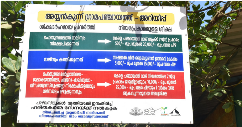
വഴിയരികിൽ സ്ഥാപിച്ച ശുചിത്വ സന്ദേശ ബോർഡ്

ഹരിത കേരളം മിഷന്റെയും ജില്ലാ ശുചിത്വ മിഷന്റെയും ആഭിമുഖ്യത്തിൽ അയ്യൻകുത്തിൽ ഗ്രാമപഞ്ചായത്തിൽ ശുചിത്വ സന്ദേശ ബോർഡുകൾ സ്ഥാപിച്ചു. കേന്ദ്രവിഷ്കൃത പദ്ധതിയുടെ ഭാഗമായി ഓരോ ഗ്രാമ പ്രദേശവും സമ്പൂർണ്ണ ശുചിത്വത്തിലേക്ക് എത്തുന്നതിനുവേണ്ടിയുള്ള ജില്ലാ ശുചിത്വ മിഷന്റെ പരിപാടികളുടെ തുടർച്ചയായാണ് ബോർഡുകൾ സ്ഥാപിച്ചത്.