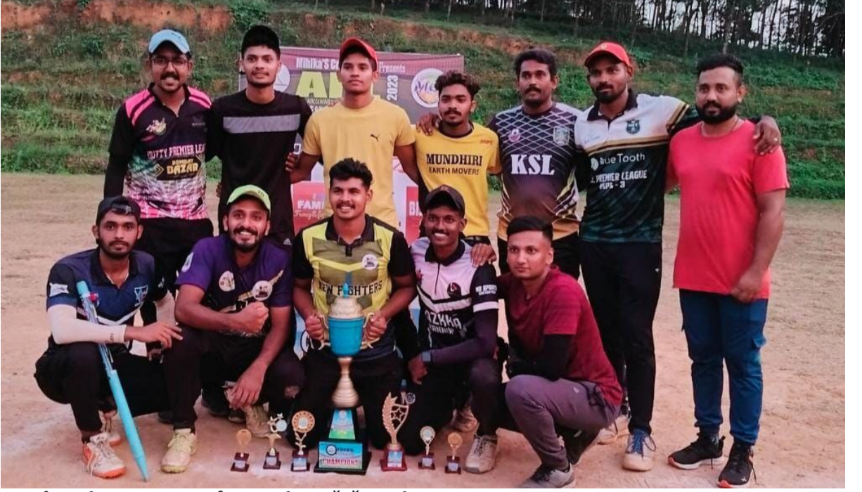
എ. പി. എൽ ജേതാക്കളായ ടീം ട്രാവൽ റെറ്റ്സ് എടുർ