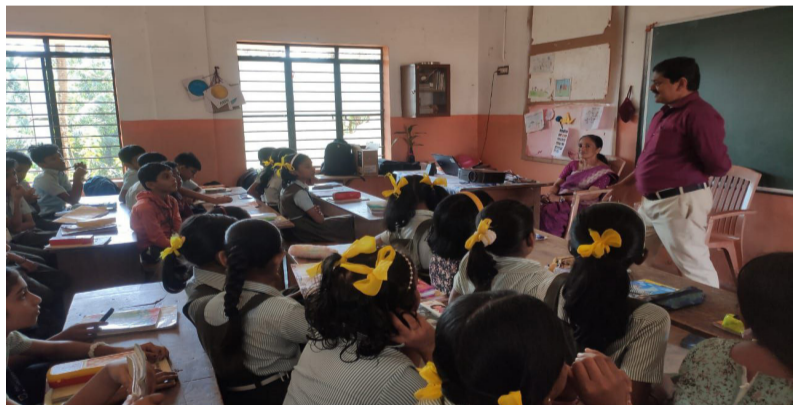
ഇലയുടെ വർക്ക്ഷോപ്പിൽ നിന്ന്

അങ്ങാടിക്കടവ് : കുട്ടികളിൽ സർഗാത്മക ശേഷി വളർത്താനുള്ള എൻഹാൻസിങ് ലേർണിംഗ് ആംബിയൻസ് 'ഇല' പരിപാടിക്ക് സേക്രഡ് ഹാർട്ട് യു.പി സ്കൂളിൽ തുടക്കം കുറിച്ചു. സ്കൂൾ ഓഡിറ്റോറിയത്തിൽ വച്ച് ഗ്രാമപഞ്ചായത്ത് പ്രസിഡന്റ് കൂടാതെ പൈതൃകമന്ത്രിയുടെ സഹായത്തോടെ, 'ഇല' (എൻഹാൻസിങ് ലേർണിംഗ് ആംബിയൻസ്) യുടെ ഉദ്ഘാടനം നിർവഹിച്ചു.