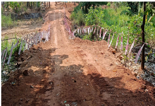
പുഴയിലൂടെ നിർമ്മിച്ച താൽക്കാലിക റോഡ്