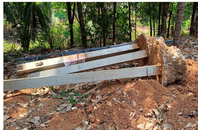
പൊളിച്ച മാറ്റിയ നിർമ്മാണം പൂർത്തിയാക്കാതെ കാത്തിരിപ്പ് കേന്ദ്രം

ആനപ്പന്തി: മലയോര ഹൈവേ വികസനത്തിന്റെ ഭാഗമായി ആനപ്പന്തിയിൽ പുതിയ പാലം നിർമ്മാണം ആരംഭിച്ചു. വള്ളിത്തോട് അമ്പായത്തോട് മലയോര ഹൈവേയുടെ നവീകരണത്തിന്റെ ഭാഗമായാണ് വീതികുറഞ്ഞ ആനപ്പന്തി പാലം പുനർനിർമ്മിക്കുന്നത്.