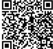
കൂടുതൽ വീഡിയോയും ഫോട്ടോകളും കാണാൻ ക്യാന്റർ കോഡ് സ്കാൻ ചെയ്യുക.

ഇടപെടുന്ന സാഹചര്യം ഉണ്ട് എങ്കിലും പലർക്കും ജീവിത പ്രാരംഭം കാരണം നാട്ടിലേക്ക് വരാൻ താല്പര്യമില്ല. പരിഷ്കൃതമായി ചിന്തിക്കുന്ന ഇരുപതാം നൂറ്റാണ്ടിലെ ജനതക്കറിയാം യുദ്ധം വിജയികളെ അല്ല സമ്മാനിക്കുന്നത്, നഷ്ടപ്പെട്ടവരുടെയും ക്രൂര ചിത്രങ്ങളാണ്. ചോരകൊണ്ടും ആയുധം കൊണ്ടുമല്ല മനുഷ്യൻ പുതുലോകം സൃഷ്ടിക്കേണ്ടത്. ചരിത്രത്തിലെ യുദ്ധങ്ങൾ നൽകുന്ന പാഠങ്ങൾ ഉൾക്കൊണ്ടുകൊണ്ട് ഈ ചോരകളെ ഇവിടെ നിർത്താം.