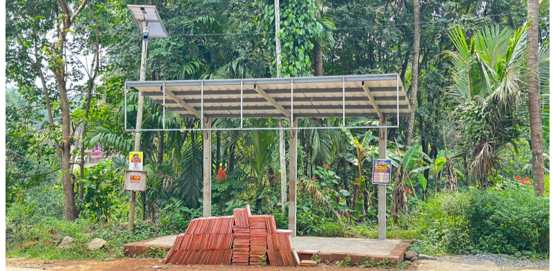
ആനപ്പന്തിക്കവലയിലെ പണിപൂർത്തിയാകാത്ത വെയിറ്റിംഗ് ഷെഡ്