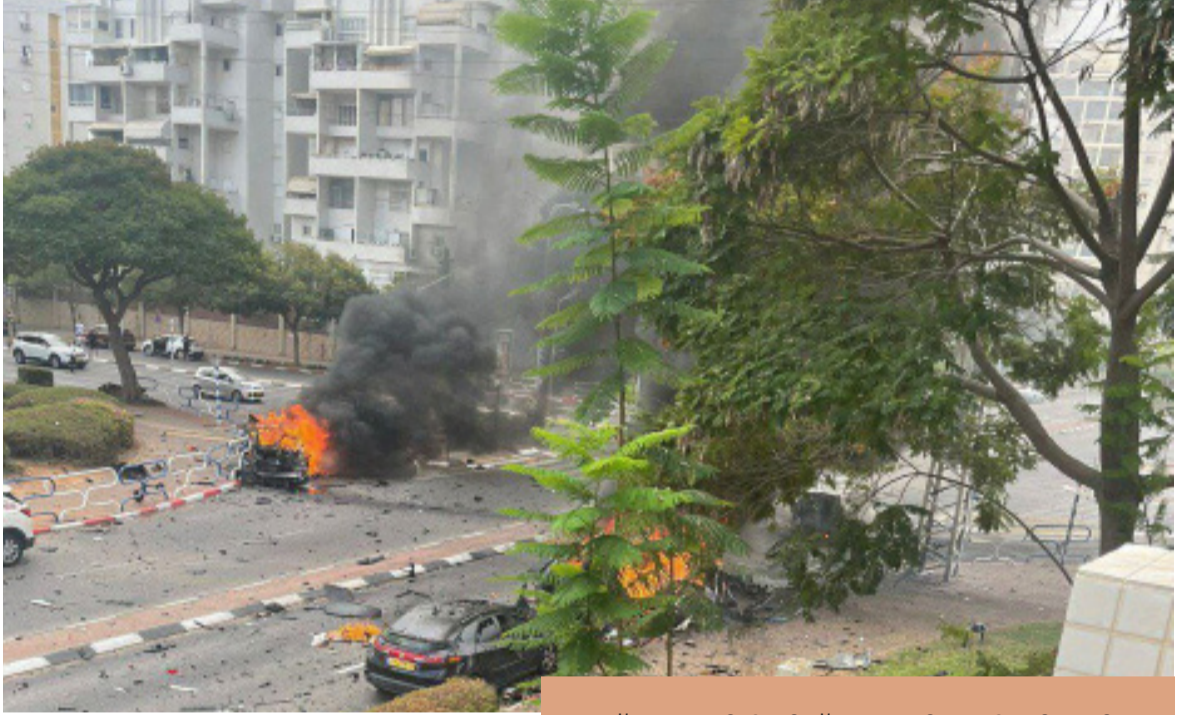
ആഷ്കലോണിൽ നിന്ന് മലയാളി പകർത്തിയ ചിത്രം

ഇസ്രായേലിന്റെ അതിർത്തി പ്രദേശങ്ങളാണ് കൂടുതൽ സംഘർഷ ബാധിത മേഖല. ഹമാസ് തീവ്രവാദികൾ ഇസ്രായേലിന്റെ ഹൃദയ ഭാഗത്തേക്ക് നുഴഞ്ഞുകയറിയിരിക്കുന്നു എന്ന് അറിയിപ്പ് ഉള്ളതിനാൽ, പലരും വീടിന് പുറത്തിറങ്ങാറില്ല. വലിയ സൂപ്പർ മാർക്കറ്റുകളും, മറ്റു സ്ഥാപനങ്ങളും അടഞ്ഞു കിടക്കുന്നു. അത്യാവശ്യം ചെറിയ ഷോപ്പുകൾ വൈകുന്നേരം ആറുമണി വരെ മാത്രമേ പ്രവർത്തിക്കുന്നുള്ളൂ. ഭയം കാരണം വീടിനുള്ളിലെ മാലിന്യം കളയാൻ പോകുമ്പോൾ വരെ കൂട്ടുകാ