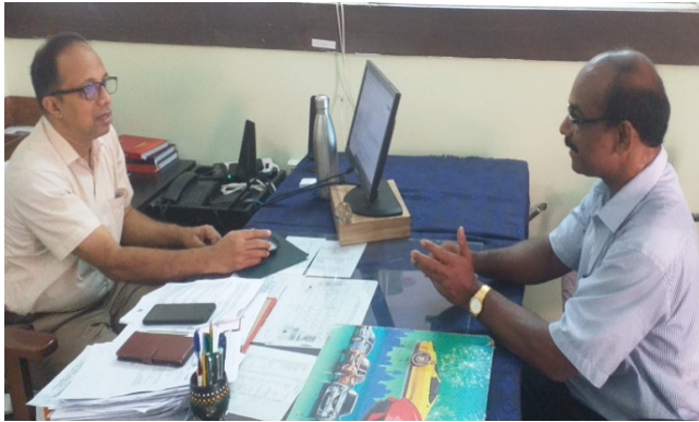
Meeting with the Dy. Collector (LA)