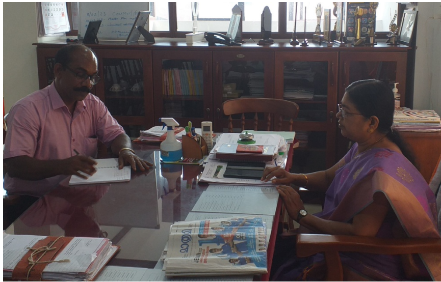
Guidance from the Corporation Mayor