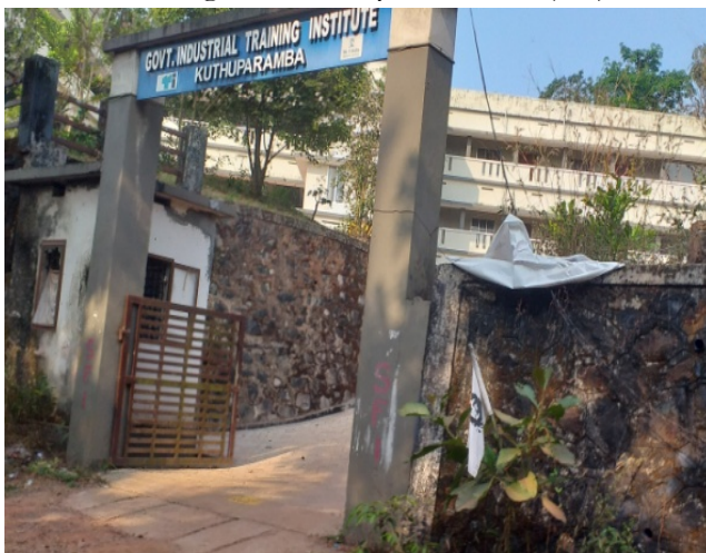
Affected Govt. ITI